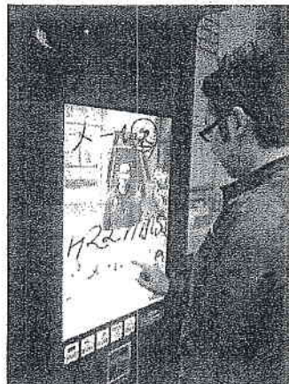
▲カメラ機能付サインージを販売