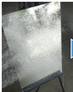
①加工前バスミラー全面を万遍なくシャワー散水します。