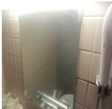
現状の白残ウロコミラー

皮脂・水垢・油分等の有機汚れ（白残）が表面に付着して通常のお手入れでは除去が不可能になっています。 解決方法はウロコが付かない特殊加工済ミラーに新品交換することが一番の近道です。 日常の簡単なお手入れで汚れの無いキレイなバスミラーが実感いただけます。