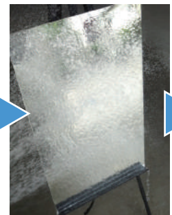
④表面が乾かないうちに①のようにミラー全面を万遍なく散水してキレイにクリーナーを洗い流します。