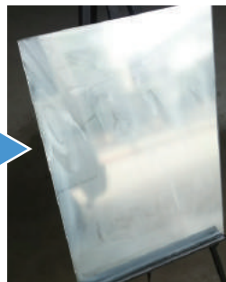
③ソフトバットに備え付けのフラッシュ・クリーナーを2～3滴垂らしミラー表面を万遍なく軽く数秒程擦ります。