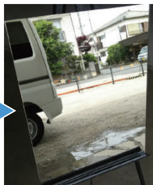
⑤すると水は鏡面に密着し流れゆくりと表面の有機物全体を洗い流し一切汚れの無い輝くキレイなバスミラーが出現します。