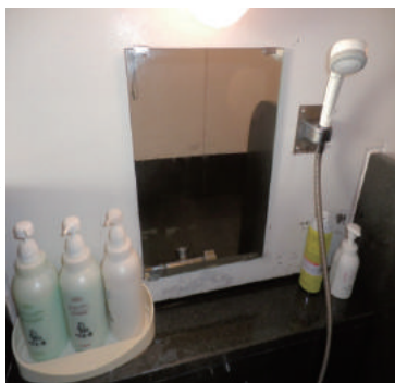
新品交換した加工ミラー