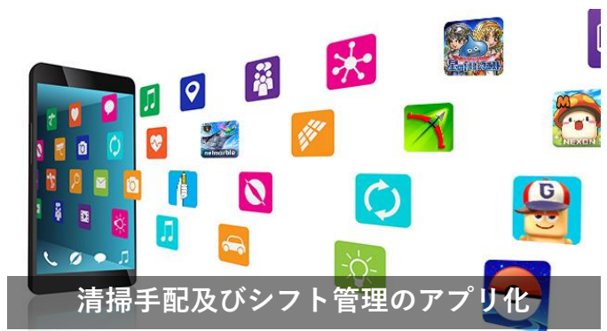
清掃手配及びシフト管理のアプリ化