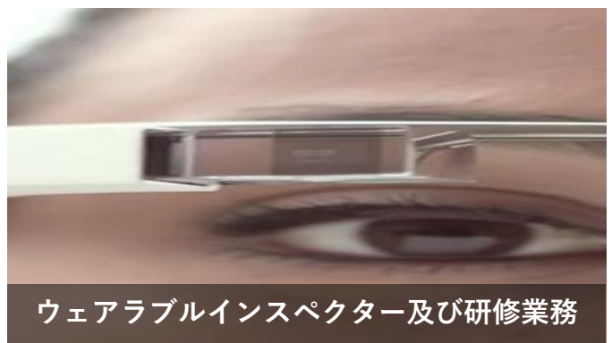
ウェアラブルインスペクター及び研修業務