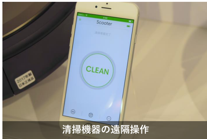
清掃機器の遠隔操作